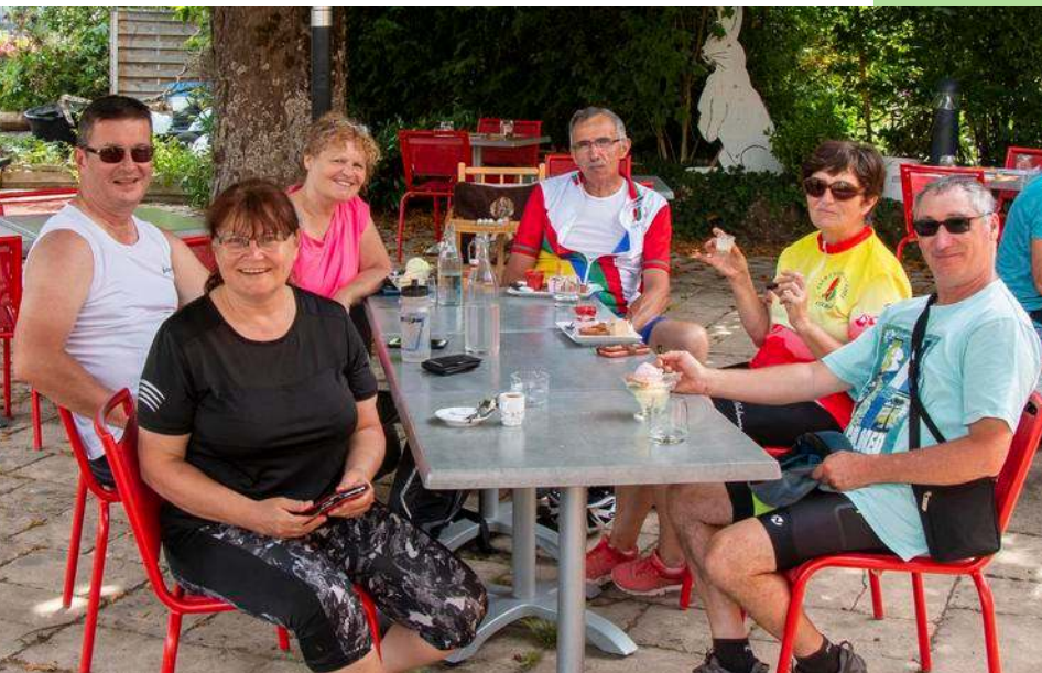
Pause gourmande à Villé

Nous arrivons bientôt à Thanvillé, cité qui s'est construite le long de l'antique voie romaine et ancienne Route du Sel, voie de communication importante pour le Val de Villé qui reliait jadis les salines de Lorraine aux pays germaniques.